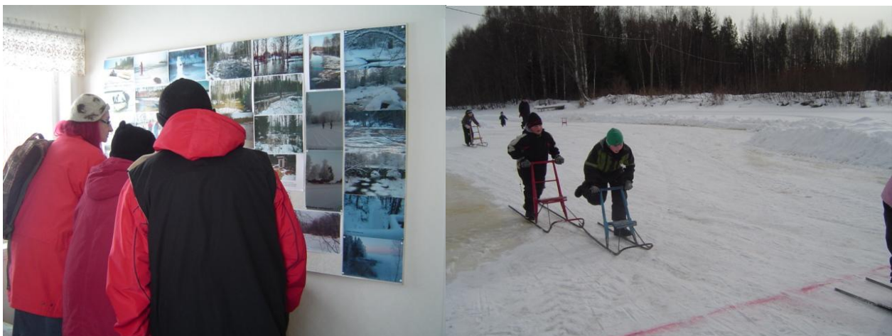
Kuva 3. Valokuvanäyttely Vanha-Putajalla kuva 4. Kelkkakisat 6.3.2010.

Elinkeinoelämätiimin hankkeen aikataulun mukaiset tapahtumat, retket ja näyttelyt on järjestetty ja uusia tapahtumia suunnitellaan kokoajan. Elinkeinoelämätiimille kuuluvien osahankkeiden tavoitteet ovat toteutuneet aikataulussa ja uusia ideoita Ahlaisten matkailu – ja virkistystoiminnan kehittämiseksi on jo valtavasti.