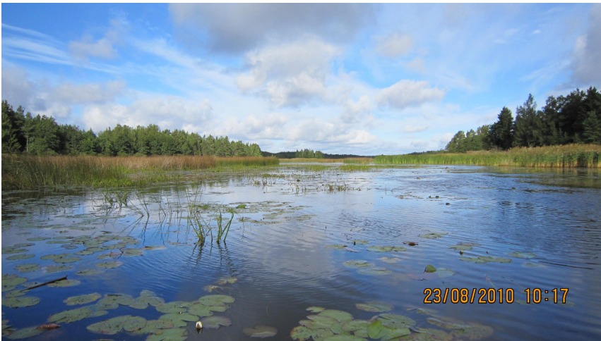
Kuva 5. Mustalahden maisemia.

Luonnonhoitotiimin on tehnyt esiselvitystä alueen kehittämismahdollisuuksille ja tutustunut muiden hankkeiden toimintaan ja soveltuvuuteen Ahlaisten kohdalla. Luonnonhoitotiimin toiminta ja tavoitteet suunnittelussa on edennyt aikataulun mukaisesti.